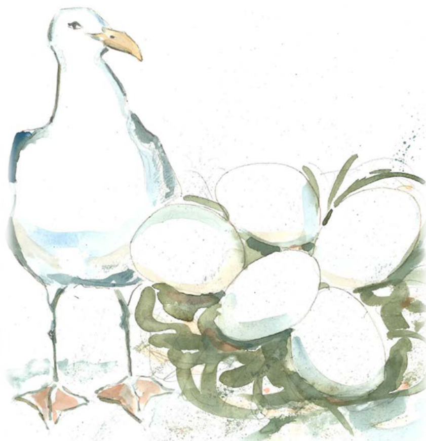
Illustrasjon: Anne Lene Groven

Denne strategiske planen skal bidra til at Kragerøskolene (SFO inngår i denne betegnelsen) jobber i samme retning over flere år, innenfor det handlingsrommet som eksisterer. Grunnen til at det er utarbeidet en egen strategisk plan, er for å gi et ekstra fokus på grunnopplæringen i kommunen.