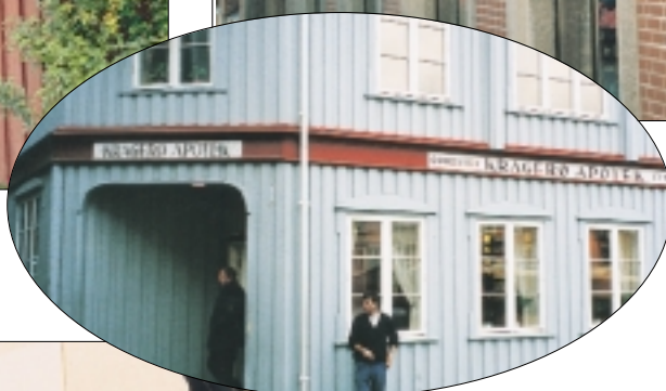
Kragerø Apotek, Kragerø