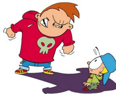
Mobbing forutsetter ujevnt styrkeforhold