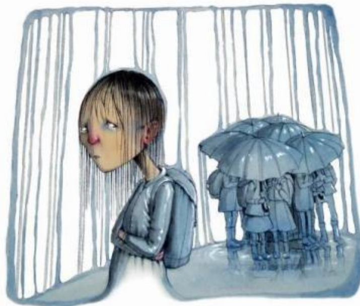
Aktive, tydelige, synlige voksne

Sosial kompetanse hos barn handler mest om å oppdra seg selv som voksen.