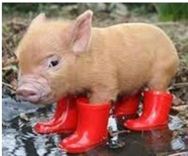
Det skal være lov å skille seg ut